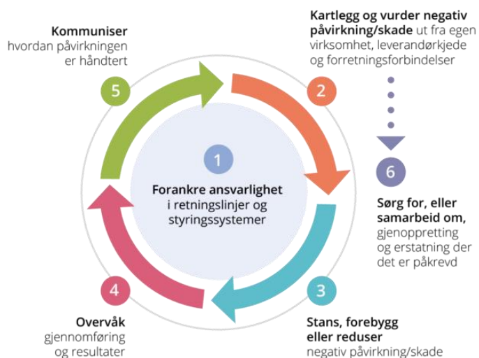
Figur 1 OECDs modell for aktsomhetsvurderinger for ansvarlig næringsliv.

Åpenhetsloven innebærer også at enhver har rett til informasjon om hvordan Norsk helsenett håndterer faktiske og mulige negative konsekvenser med bakgrunn i aktsomhetsvurderingene.